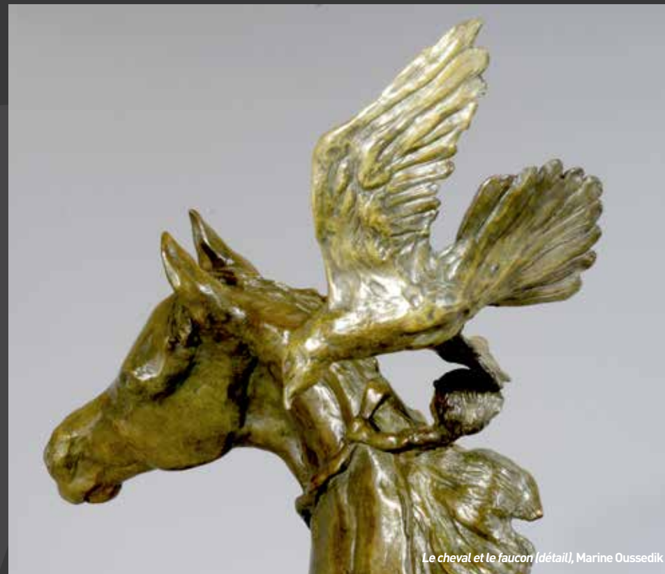
Le cheval et le faucon (détail), Marine Oussedik